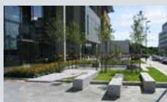
BI Nydalen Campus 44

Omvisning lørdag 14.10 og søndag 15.10 kl 14.00 og kl 15.00. Møteplass: Krysset Tøyenbekken/Mandallsgate