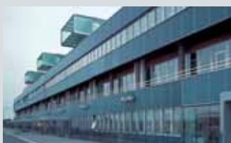
IT Fornebu Martin Linges vei 16, Fornebu