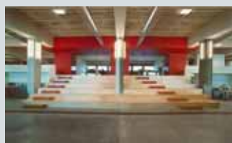
Snøhetta AS Skur 39 Vippestangenkaia 39