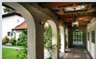
Elsero, Arnstein Arnebergs vei 3, Madsrudhøyden