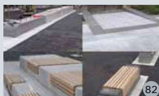
De nye Grønlandskvartalene bak Det Åpne Teater, Tøyenbekken/Mandallsgate 82

Omvisning lørdag 14.10 kl 14.00-16.00 v/Lars Flugsrud Møteplass: ved fontenen