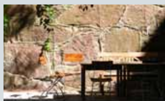
Gårdsrom Marselisgate 31 80

Åpent lørdag 14.10 kl 12.30-13.30 Omvisning kl. 12.30 og 13.00 v/ Mona Kramer Wendelborg