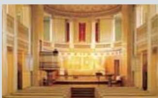
Slottskapellet Henrik Ibsens gate 1

Åpent lørdag 14.10 for omvisninger kl 10, 11, 12, 13, 14 og 15. Forhåndspåmelding kan foretas (liste legges ut) i Finans-dept fra morgenen av.