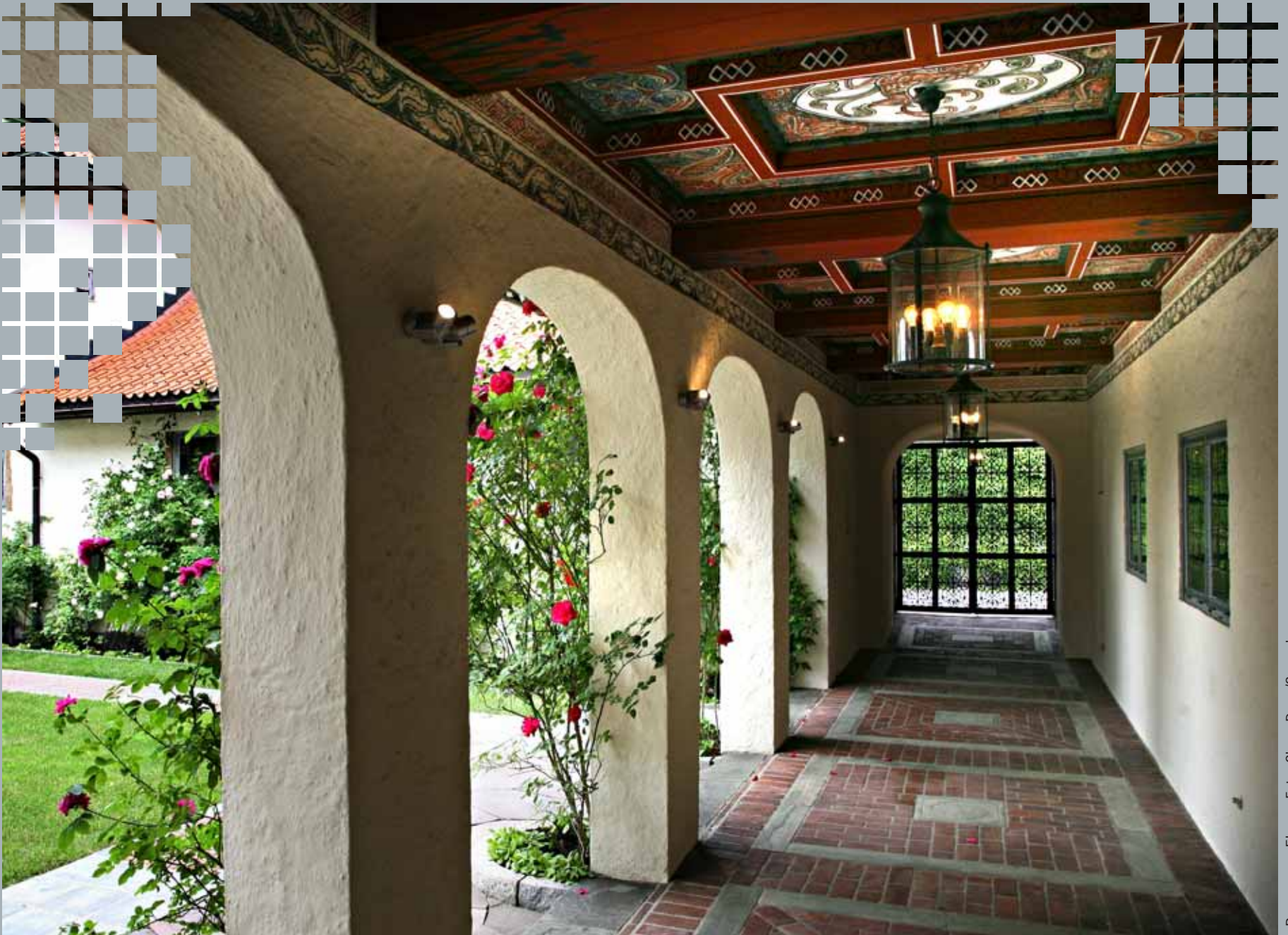
Buegangen Elsero.

BESØK ARKITEKTONISKE PERLER OG HEMMELIGE HAGER 14. - 15. OKTOBER 2006