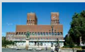
Oslo Rådhus Rådhusplassen 1

Åpent lørdag 14.10 og søndag 15.10 for omvisning begge dager kl 14.00-15.00. Fremmøte ved Infosenteret v/Karpedammen.