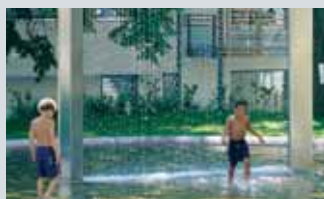
Pilestredet Park Pilestredet, (inngang fra buet portal)