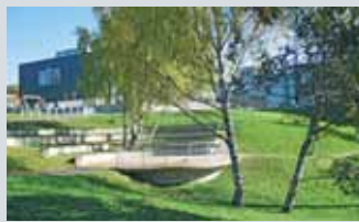
Nye Løren skole Økern Torgvei 40 85

Guidet tur m/ landskapsarkitekt lørdag 14.10 og søndag 15.10 kl 14.00 og kl 15.00. Møteplass: Foran hovedinngangen til BI i Nydalsveien.