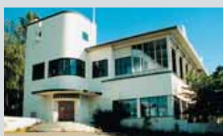
Ekebergrestauranten Kongsveien 15 58

Restaurant oppført for Oslo kommune 1927-29 av arkitekt Lars Backer. Rendyrket funkis. Et av byens første byggverk i den nye stilen, nå den eldste gjenværende. I dag overtatt av Eiendomspar og totalrenovert til en av byens mest populære restauranter.