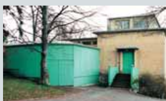
Edvard Munchs atelier Jarlsborgvn. 14, Hoff 60

Åpent lørdag 14.10 og søndag 15.10 fra kl 11.00