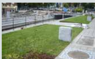
Park Nydalen/ Akerseiva II, Nydalen 84

Første del av et nytt parkanlegg langs Akerseiva, med 80 m langt svømmebasseng og med en hydraulisk demning, midt i Nydalen. Granitt-tribuner, gressarealer og promenade. Landskapsarkitekt Multiconsult as Seksjon 13.3 Landskapsarkitekter