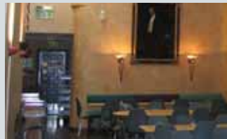
Forlaget Aschehoug Sehesteds gate 3

Åpent lørdag 14.10 og søndag 15.10 kl 12.00-14.00.