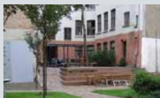
Gårdsrom Meyerløkka nord Inngang Frimannsgt. 20 86

Nylyg rehabilitert gårdsrom med høy materialkvalitet. Hyggelige sitteplasser, utegrill, lek og frodig vegetasjon. Inngår i et større rehabiliteringsprosjekt hvor tilgrensende gårdsrom er åpnet opp og slått sammen. Landskapsarkitekt Remark! landskap as