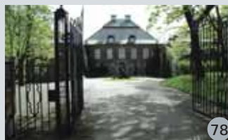
Administrasjonsbygg for Choice Hotels Scandinavia AS, Fr. Stangsgt. 22-24

Åpent lørdag 14.10 kl 09.00-14.00 og søndag 15.10 kl 12.00-14.00 Ta Sognsvannsbanen til Sognsveien st.