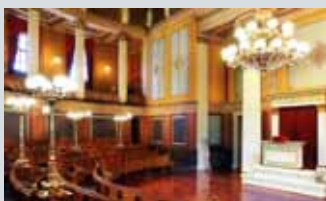
Domus Academica "Urbygningen"

Alle de tre universitetsbygningene holder åpent søndag 15.10 kl 11.00-15.00