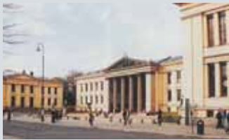
Universitetet i Oslo Karl Johans gt. 46