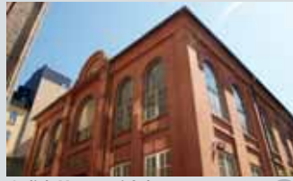
Jødisk Museum i Oslo Calmeyers gate 15 B

Åpen kirke søndag 15.10 kl 12.00-14.00. Gudstjeneste søndag 15.10 kl 11.00-12.00.