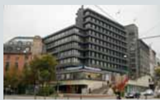
Narud Stokke Wiig AS Rådhusgt. 27, (inng. Rosenkrantzgate)