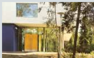
Riksarkivet, Folke Bernadottesvei 21 (ved Sognsvann stasjon)