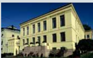
Det Norske Nobelinstitutt Henrik Ibsens gate 51

Åpent lørdag 14.10 og søndag 15.10 kl 13.00-16.00. Orientering om kapellet begge dager kl 13, 14 og 15. (Inngang Nordre Sidefløy, mot Wergelandsveien)