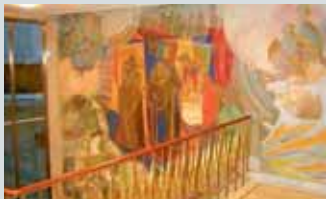
Domus Media og Aulaen

Alle de tre universitetsbygningene holder åpent søndag 15.10 kl 11.00-15.00