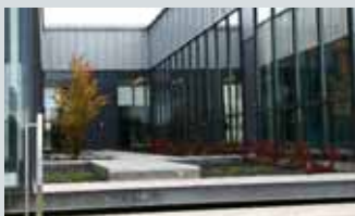
Råholt ungdomsskole, Tærudv. 1

Alle de tre universitetsbygningene holder åpent søndag 15.10 kl 11.00-15.00