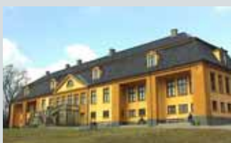
Bogstad Gård, Sørkedalen v/Bogstadvannet

Åpent lørdag 14.10 kl. 14.30 - 17.00 Omvisninger