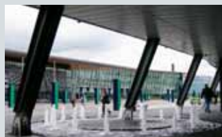
Telenor Snarøyaveien 30, Fornebu

Åpent lørdag 14.10 Kl. 11.00-13.00 Omvisninger