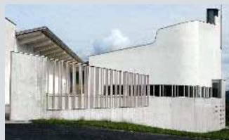
Vardåsen kirke Vardefaret 40, Asker