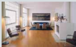
Villa Stenersen Tuengen alle 10c