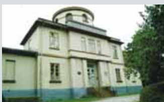
Observatoriet Observatoriegate 1