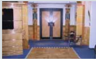
Skogbrand Forsikringselskap Gjensidig, Rådhusgate 23B