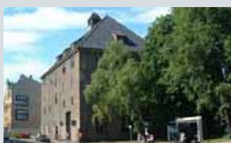
Hille Melbye Arkitekter AS Hausmannsgt. 16

Åpent lørdag 14.10 kl 12.00-14.00. Omvisning.