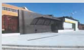
Nydalen T-banestasjon 83

Guidet tur m/ landskapsarkitekt lørdag 14.10 og søndag 15.10 kl 14.00 og kl 15.00. Møteplass: Foran hovedinngangen til BI i Nydalsveien.