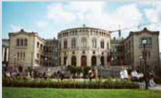
Stortingsbygningen Karl Johans gt. 22