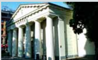
Oslo Børs Tollbugt. 2

Åpent lørdag 14.10 med omvisninger kl 10.00, 11.30 og 13.00. Begrenset antall.