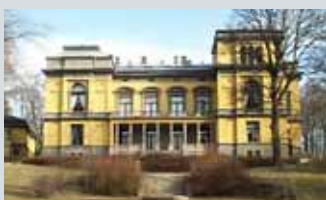
Det Norske Videnskaps-Akademi Drammensveien 78

Åpent lørdag 14.10 kl 10.00-15.00. Utover Mosseveien, ta ned Havneveien (mot Sursøya) og følg denne mot Ormsund