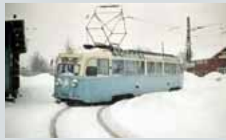
Sporveismuseet Gardeveien 15

Åpent lørdag 14.10 kl 09.00-16.00 og søndag 15.10 kl 17.00-18.00.