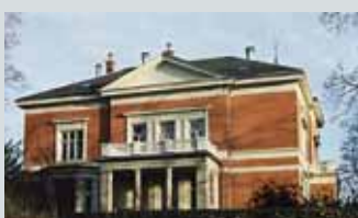
Professor Dahls gate 32/ Langårdsløkken, Briskeby

Åpent søndag 15.10 for omvisning kl 14.00 (kun åpent på dette tidspunkt)